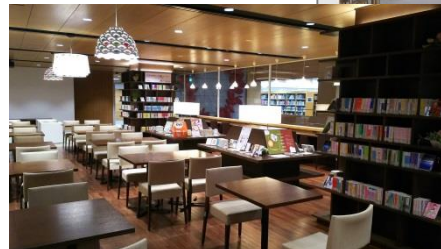
ライブラリー・カフェ