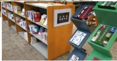
文学賞受賞作品コーナー