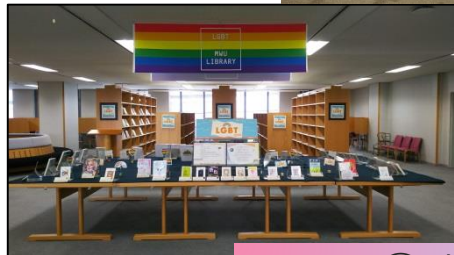
SDGs / LGBTコーナー