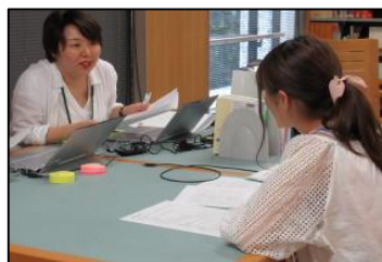
日本語ライティング支援デスク