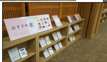
学生のお勧め本コーナー