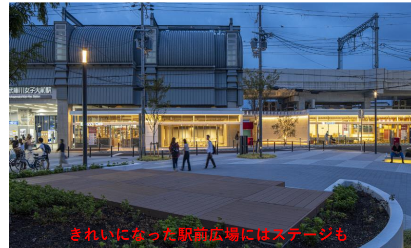
きれいになった駅前広場にはステージも