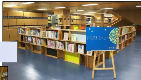
シラバスコーナー