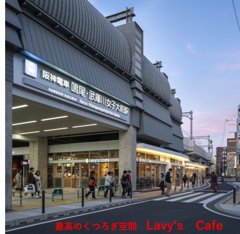
最高のくつろぎ空間 Lavy's Cafe