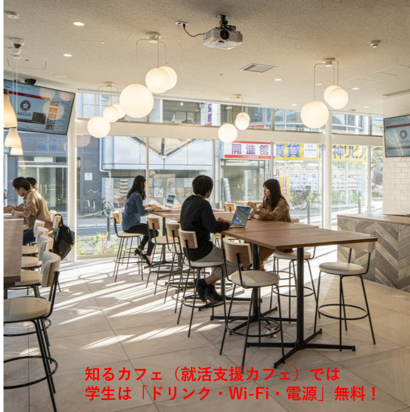
知るカフェ（就活支援カフェ）では 学生は「ドリンク・Wi-Fi・電源」無料！