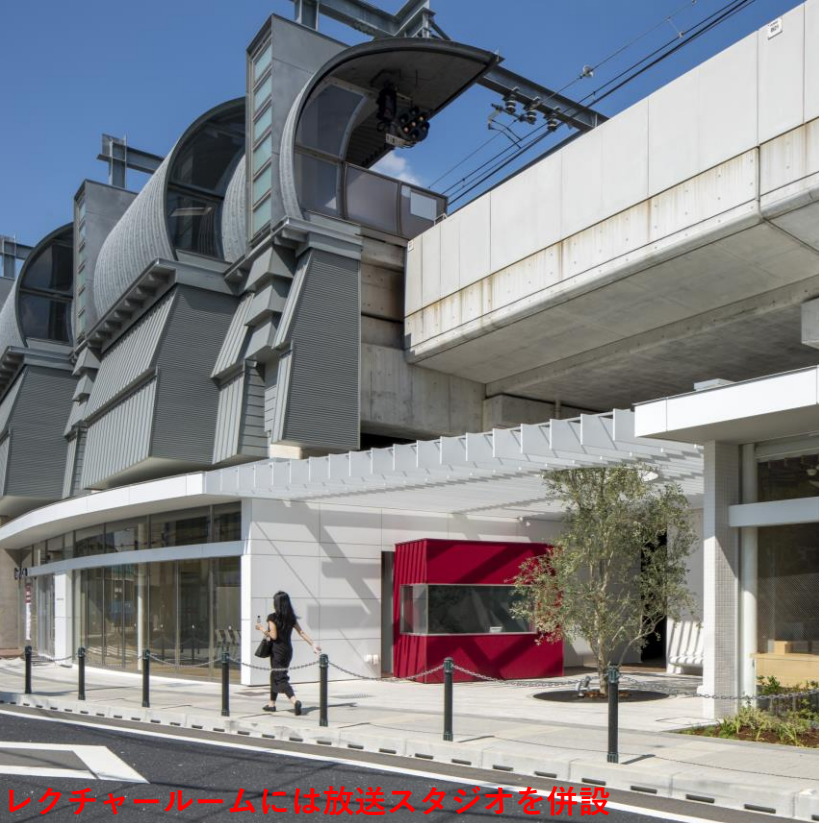
レクチャールームには放送スタジオを併設