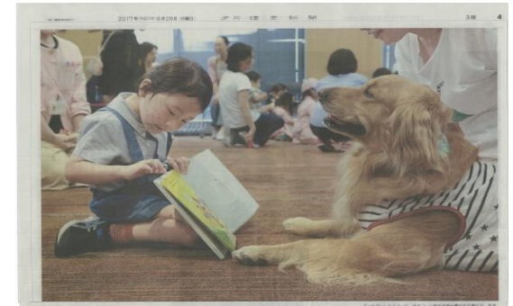
読書に関するアンケート調査