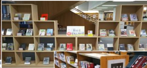
世界のノンフィクション作品コーナー