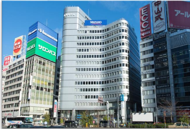
しんまきちょう 新横町ビル14F