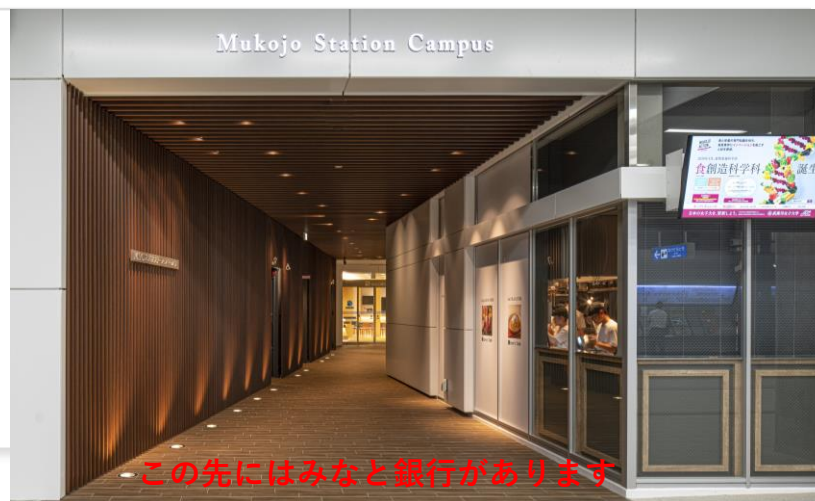
この先にはみなと銀行があります