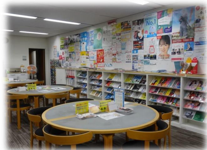
雑誌閲覧コーナー（ブース向かい側）